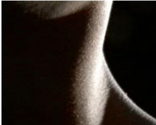
Some Hope # 01 Juin 2005 02'35 loop