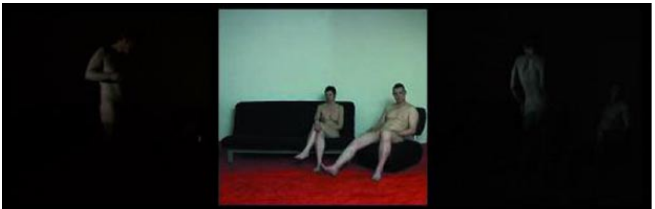
Lover's 2006 07'35 loop

Comment être ensemble? Comment être, et puis ensemble? Ensemble, nous sommes déjà, à l'unité-au singulier, déjà nous sommes un ensemble. Avec l'autre, il est lui-différent, je suis-moi, pas indifférent, trop proche dans sa-lui-nos vie à nous. Ensemble. Et alors ton corps, pas à moi que tu donnes quand même et que je prends malgré tout jamais à moi. Déjà mort. Ensemble.